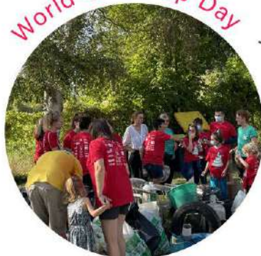
World Clean-up Day