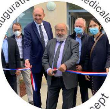
Inauguration Maison Médicale