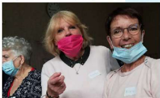
Bonne humeur et échanges d'expériences étaient au rendez-vous à chaque atelier !

Un tirage au sort a eu lieu à chaque fin de séance pour permettre aux plus chanceux de repartir avec un panier garni.